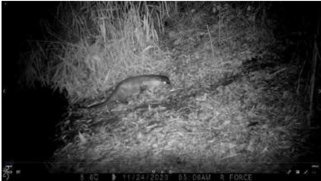
Figuur 9 Dankzij de vele wildcamera's in onze gebieden, kunnen we vaak bijzondere soorten ontdekken, zoals hier de otter.