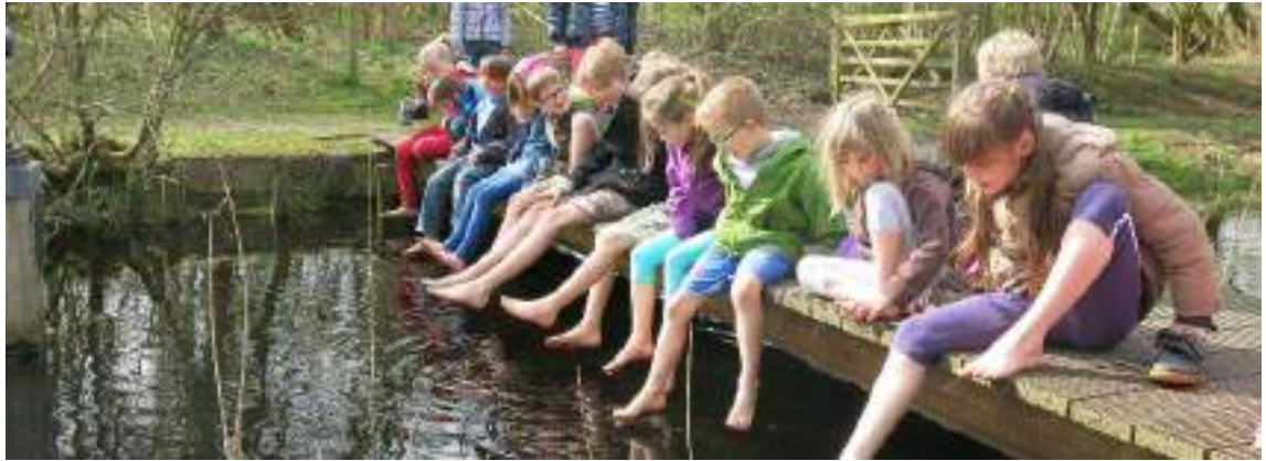
Figuur 11 Kinderen doen volop aan natuurbeleving tijdens het 'Blote voetenkamp'

We willen dat realiseren met deze acties: een specifiek aanbod uitwerken, gebaseerd op spel, beleving en ervaringsgericht leren. We proberen kinderen en jongeren te bereiken via scholen, ouders én de kinderen en jongeren zelf. We doen een denkoefening waarin we onze huidige methodes onder de loep nemen, en zetten sterker in op de acties met het meeste bereik en de grootste impact.