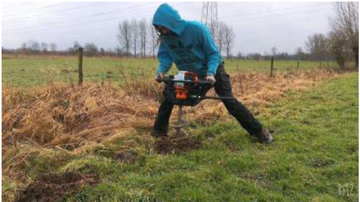
Figuur 13 Onze terreinploeg aan het werk tijdens een bebossingsactie, met het gebruik van nieuw materiaal zoals deze grondboor. Deze bebossingen kunnen tot stand komen dankzij extra financiële middelen zoals subsidies en giften.

Dat willen we realiseren door deze acties: subsidiedossiers indienen, zorgen voor meer eigen inkomsten en een alternatieve fondsenwervingsstrategie. We werken aan een sterkere samenwerking met de profitsector als mogelijke financiële partner, en bouwen een communicatiestrategie uit rond legaten en schenkingen (samen lokale notarissen). We leggen op vraag van de begeleidingscommissie een sociaal passief aan voor de medewerkers die we op basis van deze subsidie tewerkstellen.