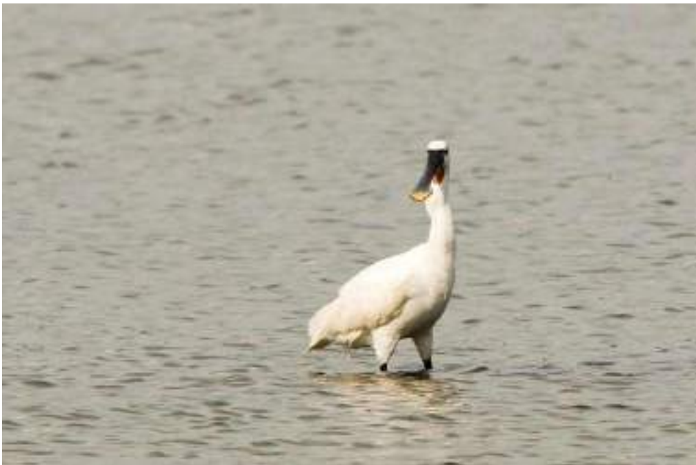
Figuur 10 De lepelaar wordt steeds vaker gespot in onze reservaten, soms zelfs als broedvogel, dankzij onze gerichte beheerwerken.

Dit willen we realiseren met deze acties: het lokaal en bovenlokaal beleid ondersteunen, actief meewerken aan overkoepelende natuurinrichtingsprojecten en meewerken aan lokale projecten. We zetten deze beleidsperiode extra in op de uitrol van het NIP Donkmeer, Rivierpark Scheldevallei, Moervaartvallei en Durmevallei. Omdat we als natuurvereniging daarin niet de enige speler zijn, willen we samenwerken met andere actoren, vooral de gemeentebesturen en de provincie Oost-Vlaanderen, andere natuurverenigingen (zoals Regionaal Landschap, lokale Natuurpuntafdelingen, andere lokale natuurverenigingen, WWF Vlaanderen) en landbouwers.