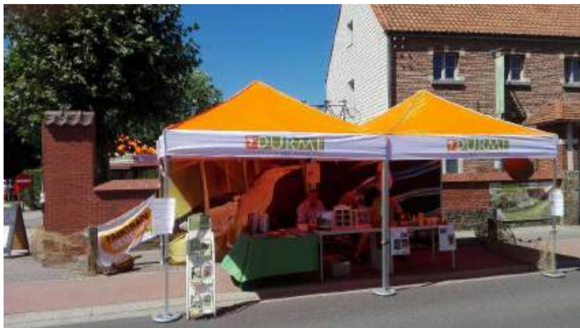
Figuur 8 Vrijwilligers van onze afdeling Zele-Berlare-Wichelen aan het werk tijdens een evenement

Nieuwe vrijwilligers worden steeds met open armen ontvangen, ook al is het soms zoeken om de geschikte taak te vinden voor ieder van hen. Zo hebben we gemerkt dat er in een coronajaar opvallend veel vrijwilligers bijgekomen zijn, én steeds meer beheervrijwilligers zich aangemeld hebben. Daarom, in combinatie met de stijgende werkdruk voor onze terreinploeg, hebben we een concept uitgewerkt van beheerteams waarin vrijwilligers zelfstandig aan de slag kunnen. Het is de bedoeling is deze de komende beleidsperiode operationeel te krijgen en uit te breiden. Het onthaal en de opleiding van vrijwilligers samen een goed vrijwilligersbeleid zijn hierbij van groot belang. (OD 4.2)