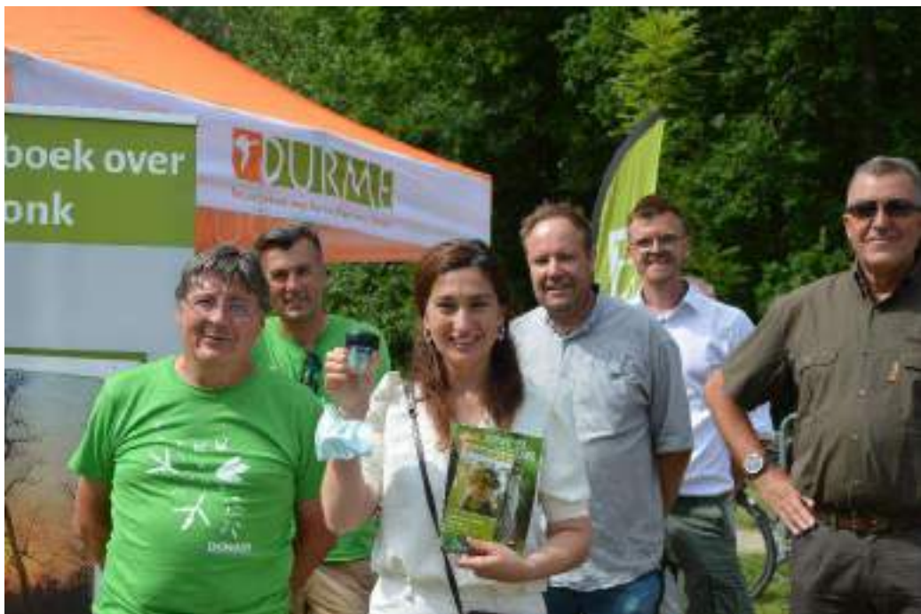
Figuur 12 Minister Zuhail Demir opent in juni 2021 de vernieuwde Eendenkooi, een succesvol project dankzij de goede samenwerking tussen vzw Durme, gemeente Berlare, ANB en VLM

Dat willen we realiseren met deze acties: duurzame contacten onderhouden met partners en gebruikers van onze gebieden, actief te overleggen en door collega-verenigingen of groepen waar mogelijk mee te ondersteunen. We zetten vooral in op de samenwerking met lokale en bovenlokale overheden, andere verenigingen, scholen en landbouwers.