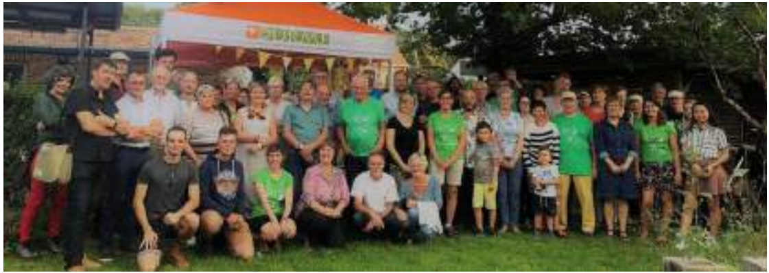
Figuur 6 Groepsfoto tijdens het vrijwilligersfeest in september 2019