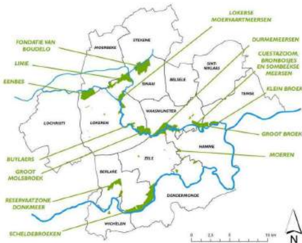
Figuur 1 Vzw Durme is actief in 12 gemeenten (ons werkingsgebied). In de 13 visiegebieden (groen op de kaart) ontwikkelen we onze reservaten.

Als een van de drie erkende terreinbeherende verenigingen (naast Natuurpunt en Limburgs Landschap) zijn we bovendien een belangrijke actor in allerlei beleidszaken.