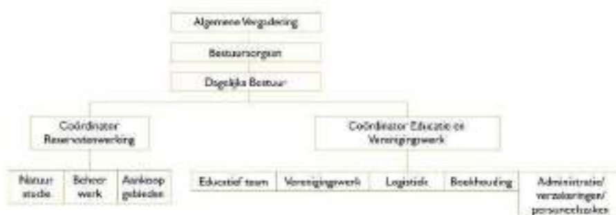
Figuur 3 Organogram vzw Durme

Vzw Durme stelt begin 2021 9,6 voltijdse personeelsleden (VTE) tewerk, occasioneel aangevuld met mensen die een contract hebben via het OCMW. Twee coördinatoren zorgen voor de dagelijkse aansturing van het team, elk op het eigen werkingsgebied: coördinator Reservatenwerking en coördinator Educatie en Verenigingswerking. Ze bereiden de begroting voor en houden de uitvoering hiervan in de gaten. Ze zijn verantwoordelijk voor de jaarplanningen en -rapportage. Ze houden een overzicht over de medewerkers, ondersteunen hen en sturen bij waar nodig. Ze zijn de rechtstreeks link tussen het personeel en het bestuur. Er is een hoge mate van zelfstandigheid onder de medewerkers. Elk heeft een eigen expertisegebied.