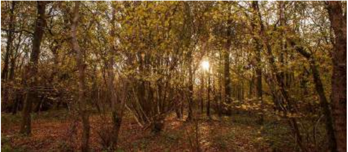
Figuur 7 Zonsondergang in de Fondatie van Boudelo, een van onze drukst bezochte reservaten.

We zijn natuurlijk niet de enige speler die ons landschap beïnvloedt. Daarom werken we actief samen met andere natuurverenigingen, landbouwers, bedrijven en organisaties. We gaan actief op zoek naar mogelijkheden om elkaar te versterken en de natuur alle groeikansen te bieden. Zo werken we samen met landbouwers om onze gebieden te beheren, met bedrijven voor advies, sponsoring en het realiseren van projecten, en met gemeentes voor campagnes, activiteiten, onze bezoekerscentra, beleidszaken. Andere natuurverenigingen zijn interessante partners bij gezamenlijke activiteiten of campagnes of om samen aan het zelfde (beleidsmatige) touw te trekken. Deze manieren van samenwerken willen we waar mogelijk verder uitbouwen in de komende beleidsperiode.