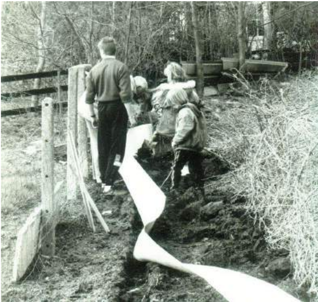
Figuur 2 Kinderen helpen al van oudsher bij de jaarlijkse paddenoverzetactie. Hier zie je hoe ze samen het paddenscherm plaatsen.

De kerndoelstellingen van onze vereniging zijn altijd hetzelfde gebleven: natuurbescherming, draagvlakverbreding (incl. natuureducatie), beleidswerking en natuurstudie. Hoewel de invulling natuurlijk meegaat met zijn tijd, bleven we onszelf al die jaren trouw.